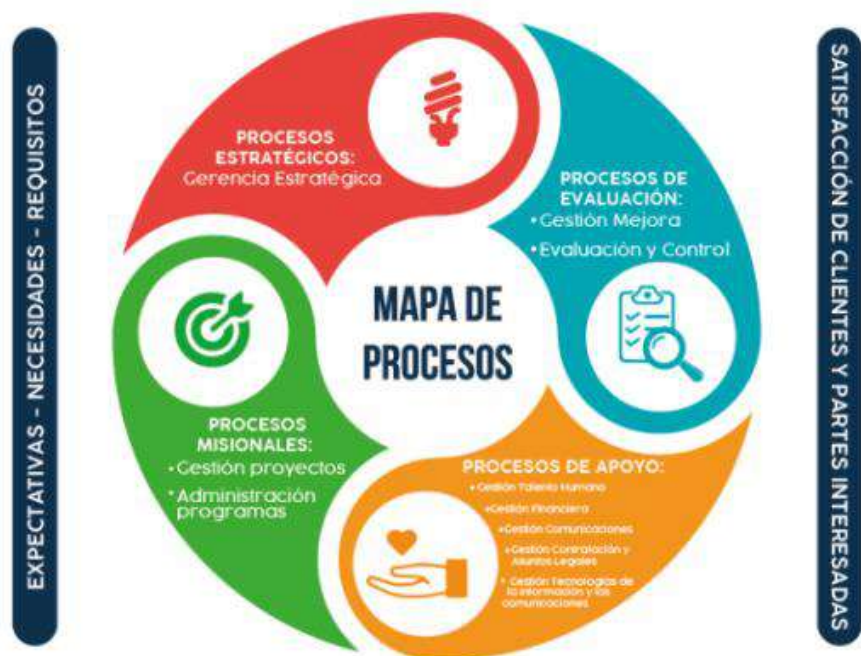
Ilustración 5. Mapa de procesos del sujeto de control