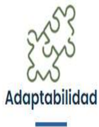
Ilustración 2. Principios corporativos SOMOS Rionegro S.A.S