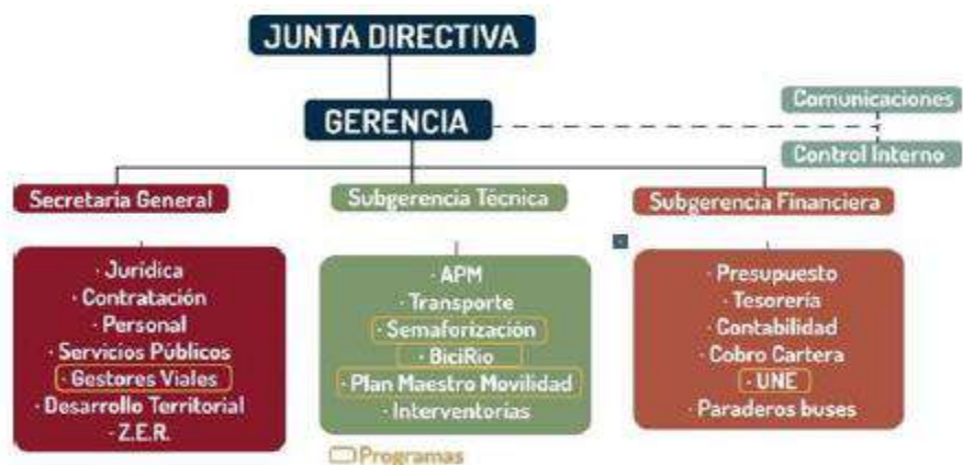
Ilustración 4. Organigrama operacional del sujeto de control