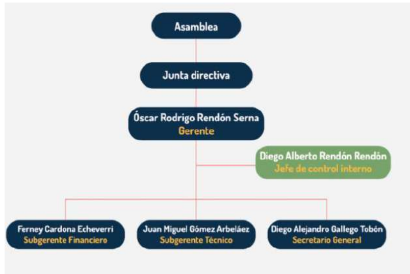
Ilustración 3. Estructura organizacional del sujeto de control