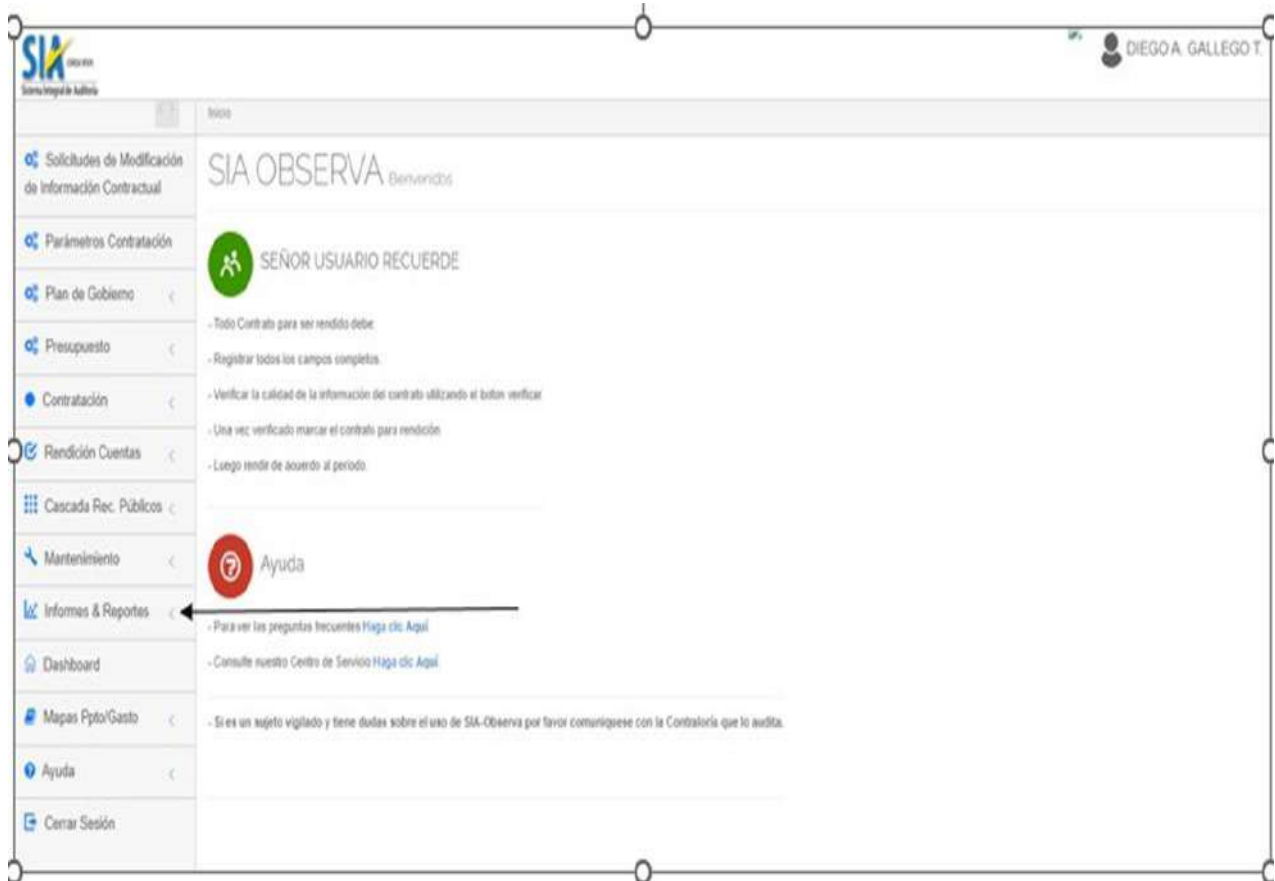
Ilustración 6 SIA Observa