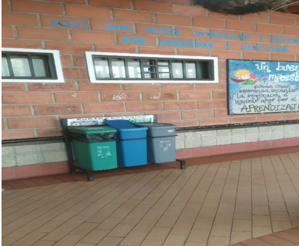
Ilustración 11 Punto ecológico de la sede Carmela Bianchetti