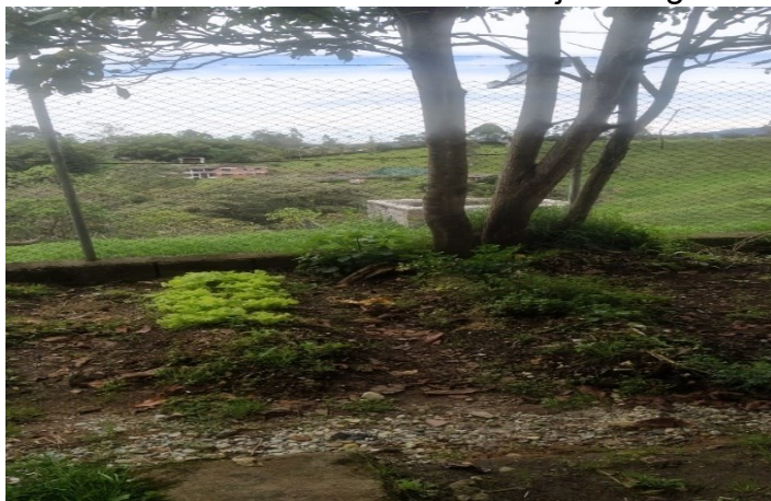
Ilustración 7 Huerta escolar sede Ojo de Agua

Fuente: Imagen huerta escolar en prueba de recorrido a la sede Ojo de Agua Preparó: Auditor del equipo auditor.