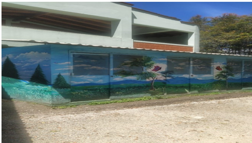
Ilustración 6 Área de almacenamiento

Imágenes del área de almacenamiento de los residuos sólidos.