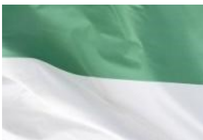
Ilustración 2 Bandera Institución Educativa Escuela Normal Superior de María

Forma: Rectangular de 2.50 metros x 2.0 metros dividida en dos franjas de igual tamaño en forma de rectángulos dirigidos hacia el horizonte y que unidas ambas