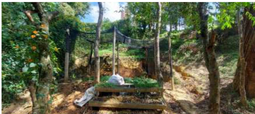
Ilustración 4 Estado de la huerta después.