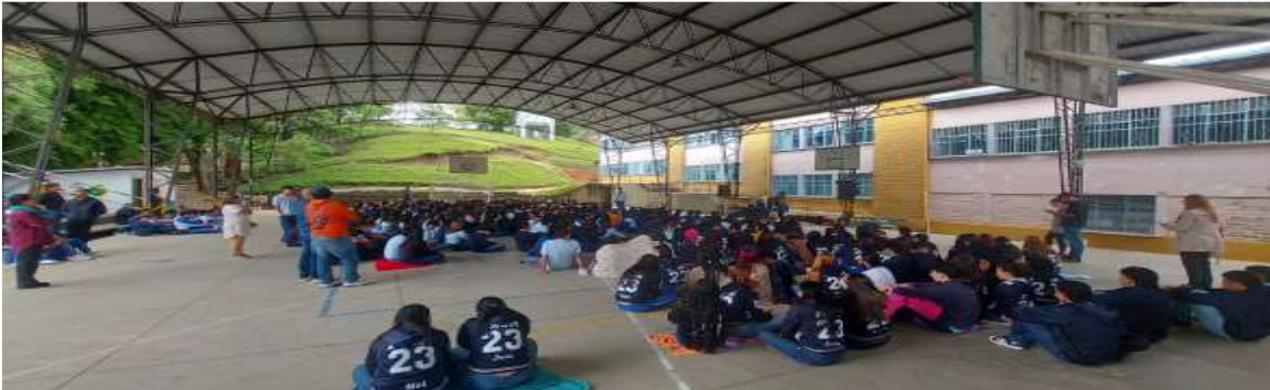
Ilustración 5 Capacitación a los estudiantes sobre el reciclaje en la sede principal