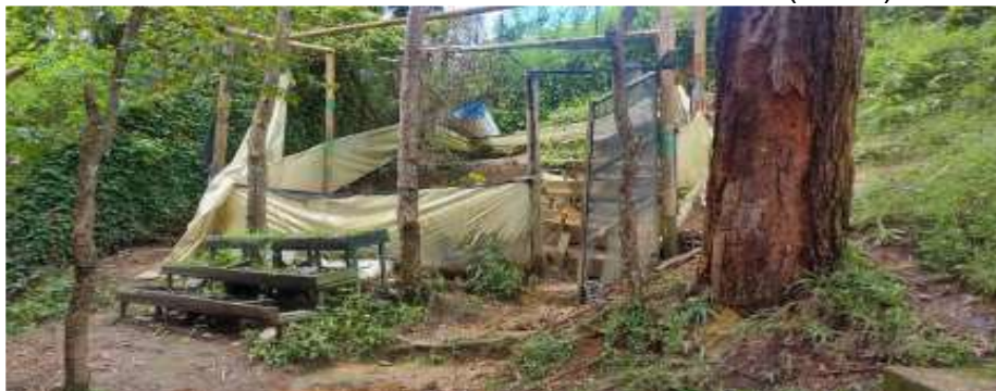
Ilustración 3 Modificación del terreno inicial (antes).