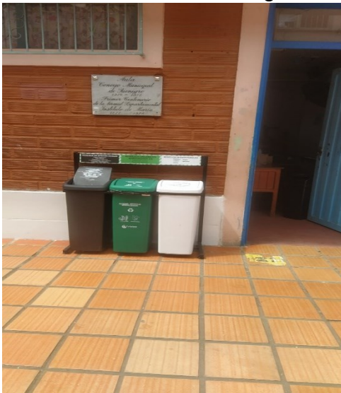
Ilustración 10 Punto ecológico