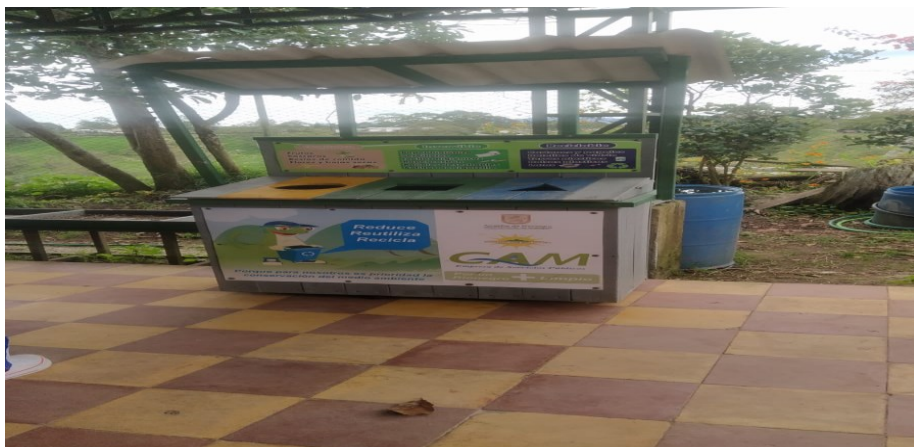
Ilustración 8 Punto ecológico en la sede de Ojo de Agua.