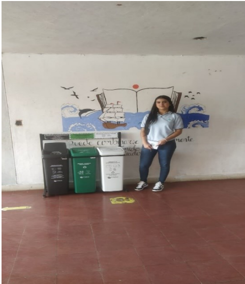
Ilustración 9 Punto ecológico