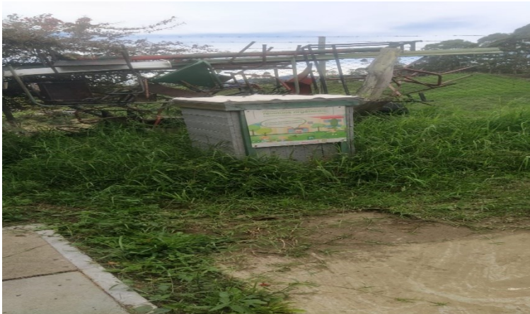
Ilustración 12 Compostera en la sede de Ojo de agua.

Fuente: Compostera en la sede Ojo de Agua de prueba de recorrido Preparo: Auditor