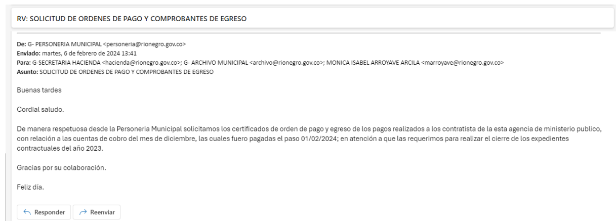
Ilustración 13 Correo electrónico solicitando a la Secretaria de Hacienda los certificados de orden de pago y egreso.

Fuente: Ilustración de correo electrónico solicitando a la Secretaria de Hacienda los certificados de orden de pago y egreso.