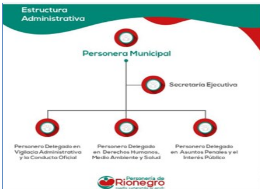
Ilustración 2. Estructura Administrativa de la Personería Municipal de Rionegro