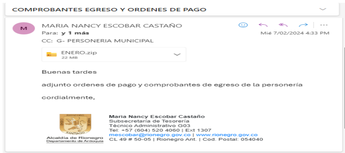
Ilustración 14 Respuesta de un correo electrónico en la cual se adjunta órdenes de pago y comprobantes de egresos de la personería.