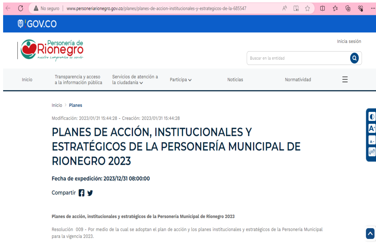
Ilustración 9 Página web de la Personería sobre publicación de planes