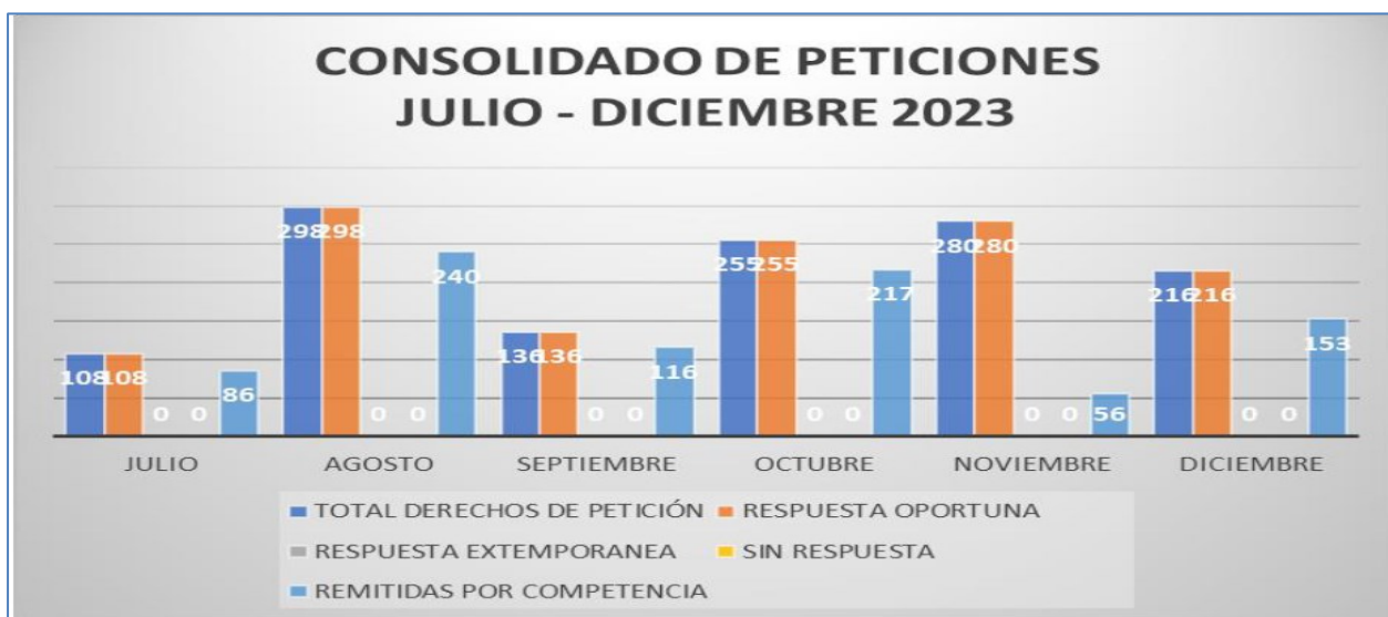
Ilustración 8 Grafico consolidado peticiones de julio-diciembre de la vigencia 2023