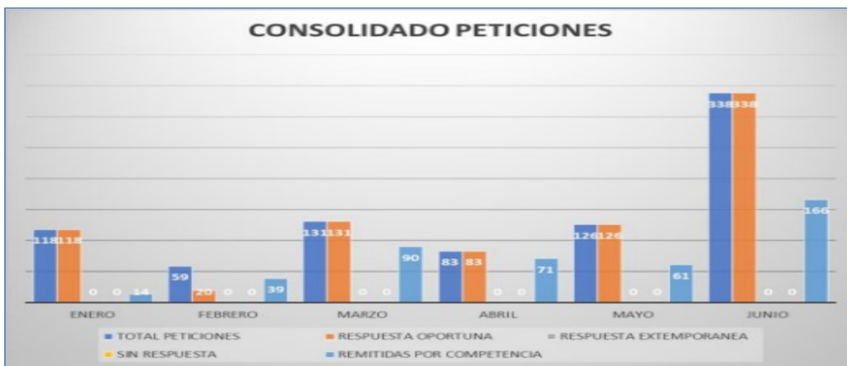
Ilustración 5. Gráfico consolidado peticiones de enero-junio de la vigencia 2023