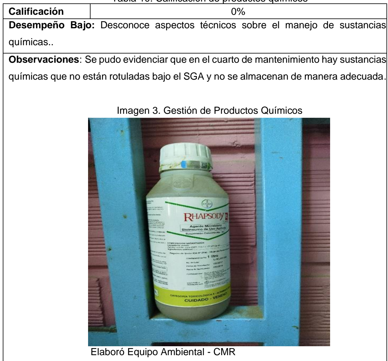
Tabla 10. Calificación de productos químicos