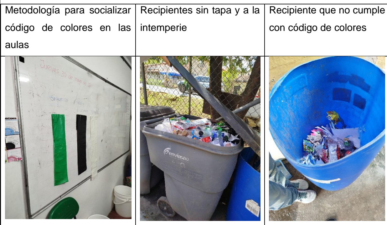
Imagen 2. Gestión de Residuos

Solo se tienen identificados los RAEE como residuos especiales o Posconsumo, estos son entregados a la secretaria de educación, sin embargo, se pudieron evidenciar algunos equipos muy antiguos almacenados en un cuarto de mantenimiento.