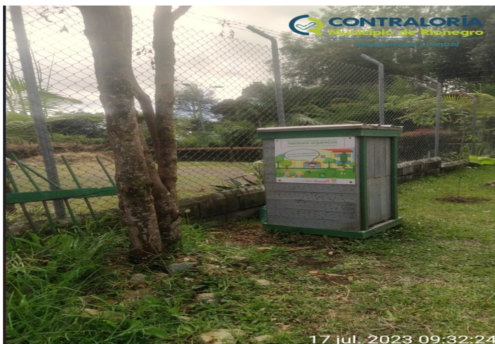
Ilustración 12. Compostera en la sede de Santa Teresa.

Fuente: compostera en la sede Santa Teresa