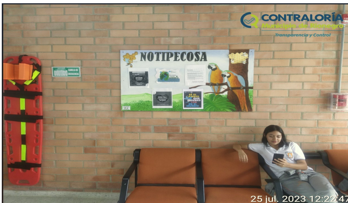
Ilustración 5. Imagen de Notipecosa del proyecto ambiental escolar PRAES

Imagen de una área común de la I.E. San Antonio.