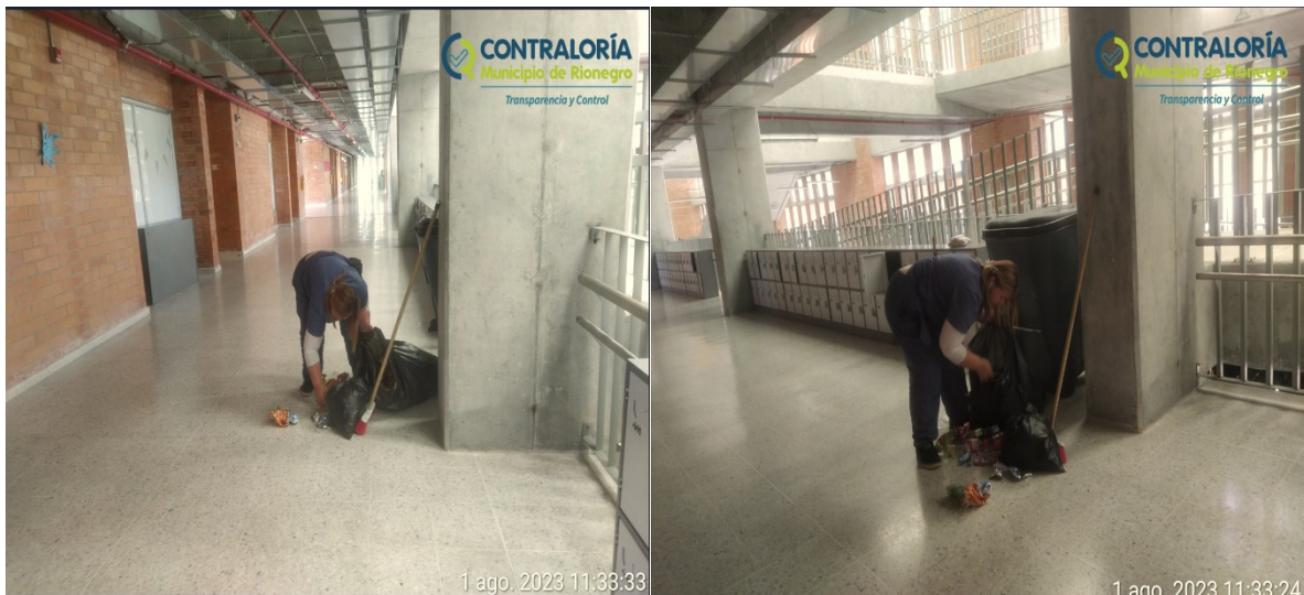
Ilustración 8. ausencia de puntos ecológicos en el segundo piso de la I.E. San Antonio, sede principal.