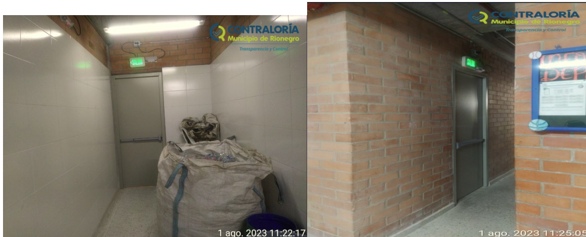
Ilustración 3. Área de almacenamiento de los residuos sólidos en la I.E. San Antonio.