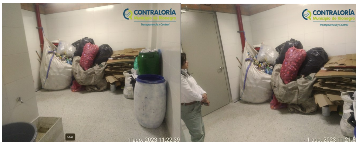
Ilustración 4. Área de almacenamiento de los residuos sólidos de la I.E. San Antonio