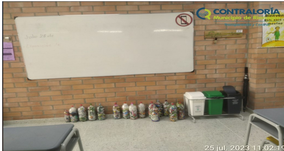
Ilustración 7. Imagen de los puntos ecológicos en las aulas de clases de la I.E.