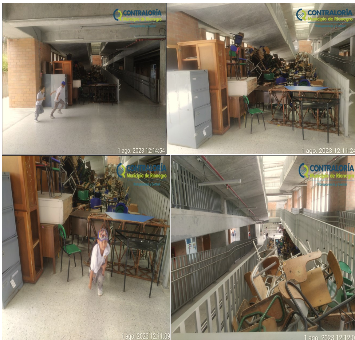
Ilustración 1. Registro fotográfico del recorrido realizado a la I.E. San Antonio