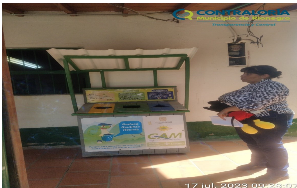
Ilustración 10. Punto ecológico de la sede Santa Teresa

En el marco del convenio municipio de Rionegro, Cornare y Prodepaz en la sede de Santa teresa se presenta una Huerta Ecológica Escolar cuyo objeto “ Aprender a sembrar con abonos naturales ”, en el cual se ejecutaron quinientos mil pesos (500.000 COP) aportados por la comunidad y una compostera.