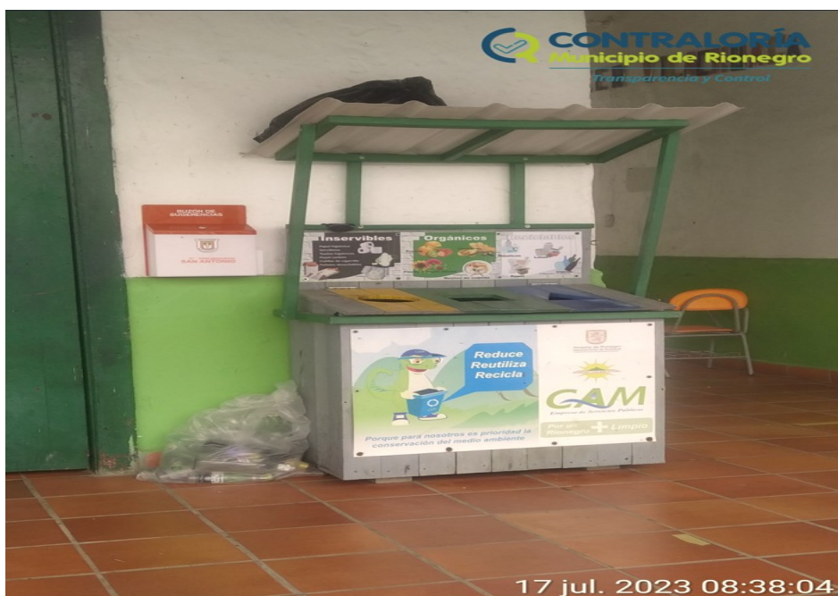
Ilustración 9. Punto ecológico de la sede Vilachuaga

La profesora encargada de la sede Vilachuaga tiene organizado un punto ecológico, con la descripción de cada de los recipientes.