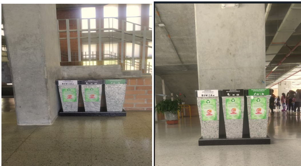
Ilustración 6. puntos ecológicos de la I.E. San Antonio primer piso

Fuente: Imágenes de dos puntos ecológicos en el primer piso.