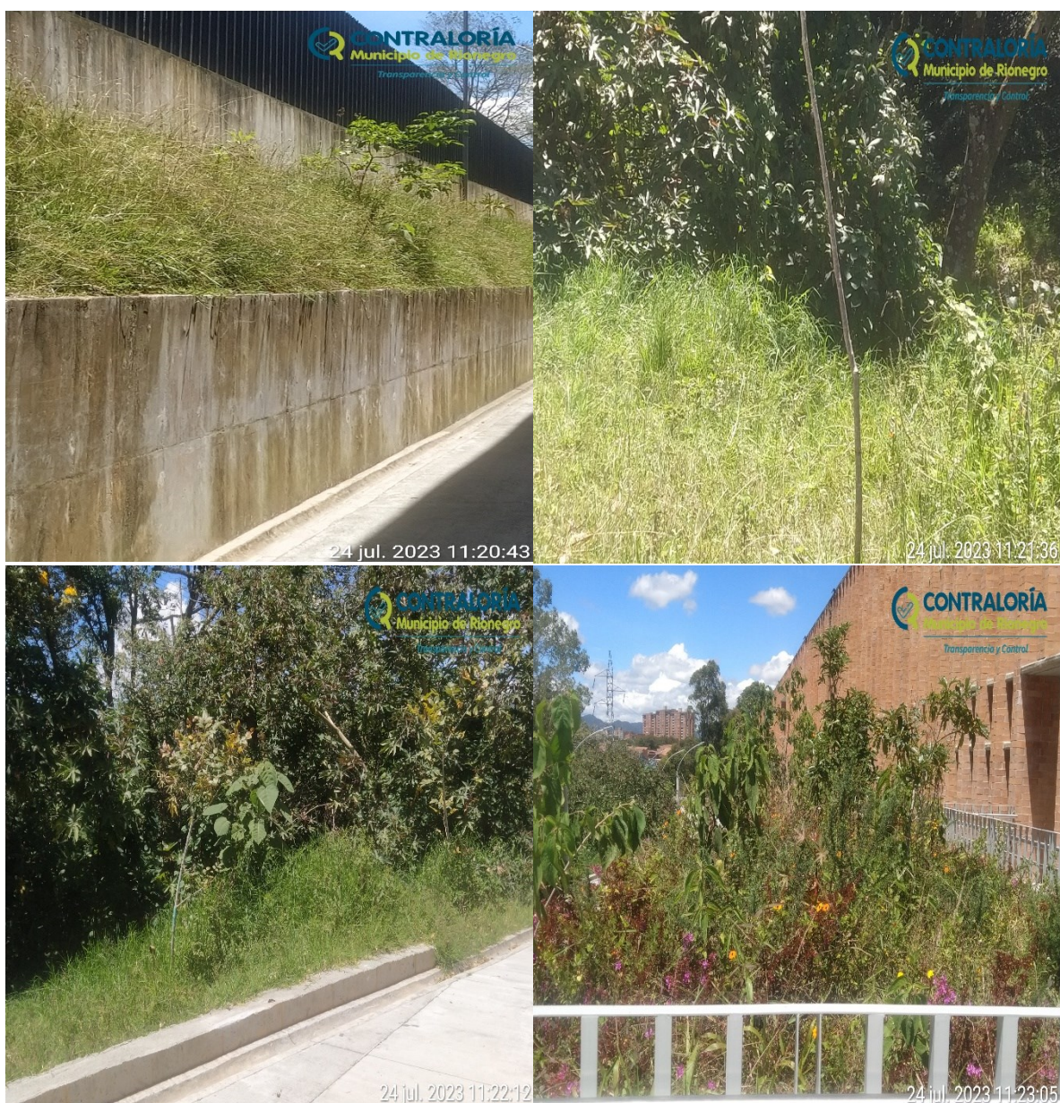
Ilustración 2. Registro fotográfico del recorrido realizado a la I.E. San Antonio

En la prueba de recorrido del proceso auditor se observó que las áreas verdes de la I.E. tienen ausencia de gestión de mantenimiento de las zonas verdes, como se describe en las siguientes imágenes: