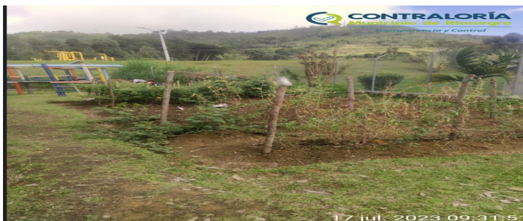
Ilustración 11. Huerta Ecológica en la sede de Santa Teresa.