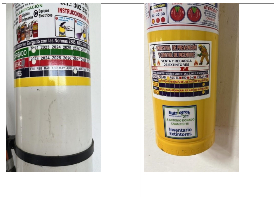
Tabla 4 Extintores I.E. Antonio Donado Camacho

Extintores: Durante las pruebas de recorrido, se evidencia que la institución educativa Antonio Donado Camacho, no dispone de extintores instalados estratégicamente como medida necesaria para combatir riesgos o incendios provenientes de las diferentes actividades realizadas, se procede a preguntar al enlace de auditoría, quien nos informa que estos se encuentran descargados, inmediatamente procede a recargarlos y se acoge a un beneficio cualitativo, cabe aclarar que así se hayan recargado, se dejara observación administrativa, para ser sometida a plan de mejoramiento, con el fin de mitigar el riesgo y este incidente no se vuelva a presentar.