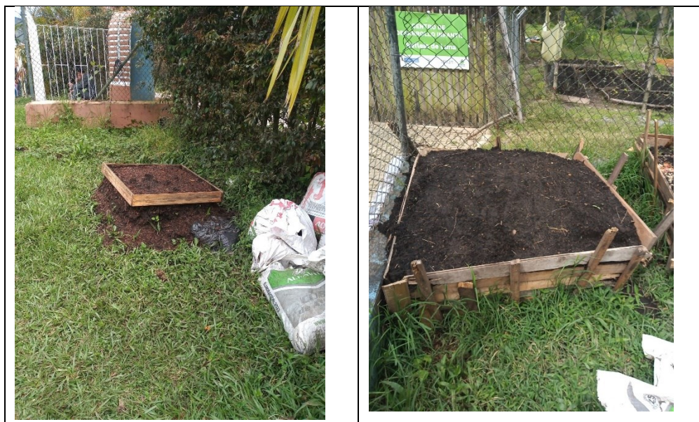
Tabla 5 Proyectos ambientales - PRAES

Fondo de Servicios Educativo Ambiental: La institución educativa identifica y reconoce la relación de recursos destinados para la gestión ambiental de la misma, relacionando los procesos, actividades y proyectos definidos para el cuidado, conservación y protección del patrimonio natural del territorio mediante el proceso educativo, no obstante, no se evidencia soportes que permitan identificar la realidad de la inversión realizada para la gestión ambiental, tanto