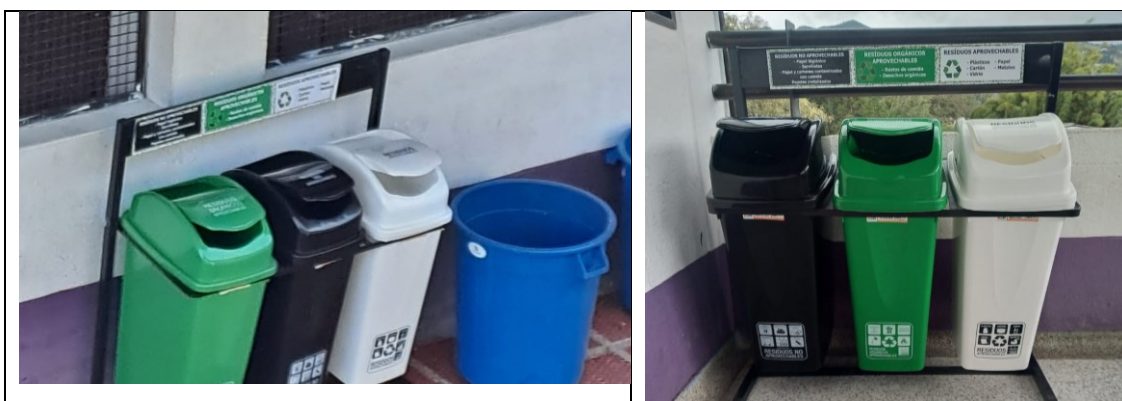
Tabla 3 Puntos ecológicos I.E. Antonio Donado Camacho