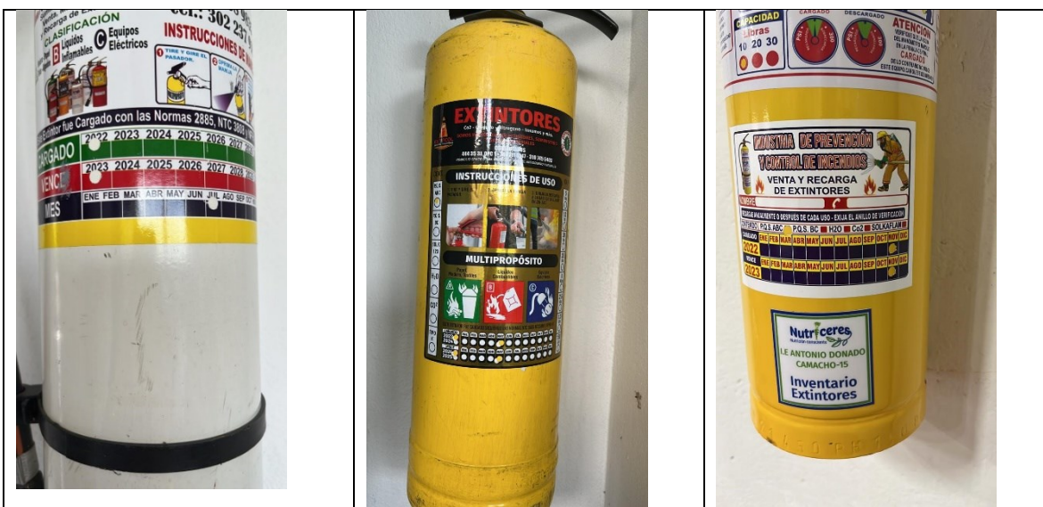
Tabla 2 Evidencia de recarga de extintores

Camacho, se procede a informar al enlace de auditoría, quien de inmediato procede a cargar los extintores y ubicarlos en puntos estratégicos de la I.E. acogíendose de esta manera a un beneficio cualitativo.